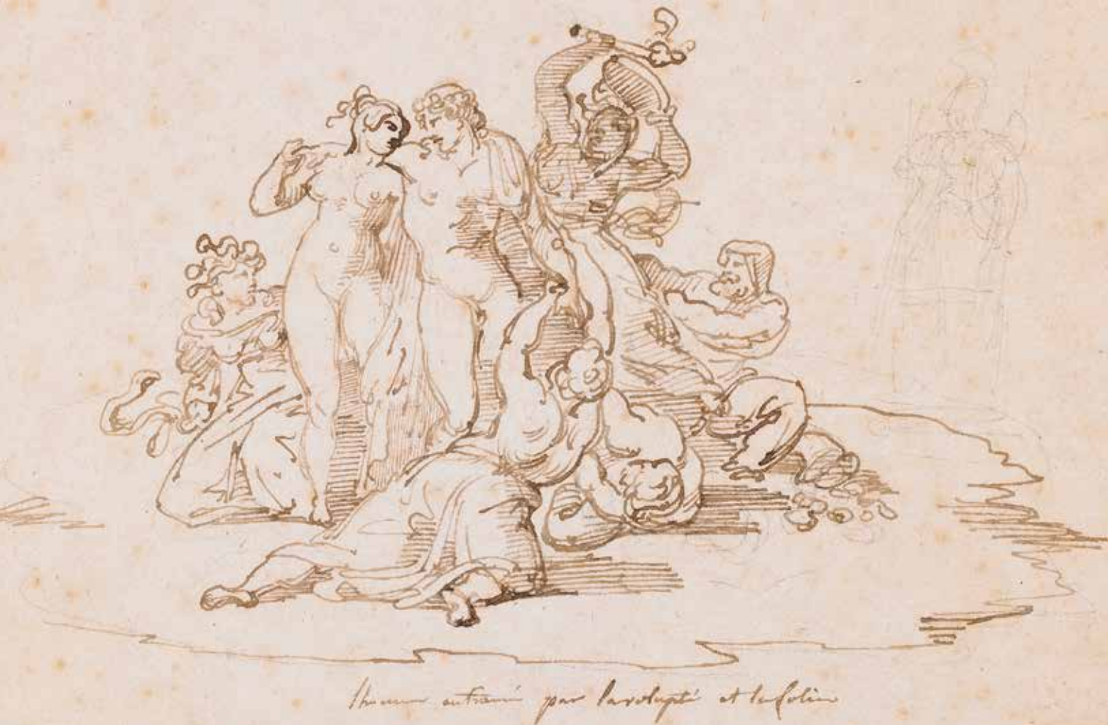
L'Homme entraîné par la volupté et la folie , 1816-1817 Mine au graphite et encre sépia sur papier, 16,9 x 21,5 cm Dijon, musée des Beaux-Arts

Rouen et à Paris. Il cultiva ce goût immodéré, marqueur de son art, dans les ateliers des deux peintres auprès de qui il se forma entre 1808 et 1816, Carle Verdet et Pierre Guérin. Ses premiers tableaux exposés aux Salons de 1812 et 1814, furent deux portraits en pied de cavaliers militaires. Le jeune artiste dévorait en parallèle les maîtres anciens, qu'il copiait sans préférence d'école ni de siècle : Raphaël, Rubens, Titien, Véronèse, Cornelis de Heem, Velásquez, Ruisdael, Jan Wijnants, Benedetto Castiglione, Carel Fabritius, Parmesan, Guido Reni, Salvator Rosa, Michel-Ange, Leonello Spada, Zurbarán, Rembrandt, et ses contemporains, Louis David, Jean-Antoine Gros.