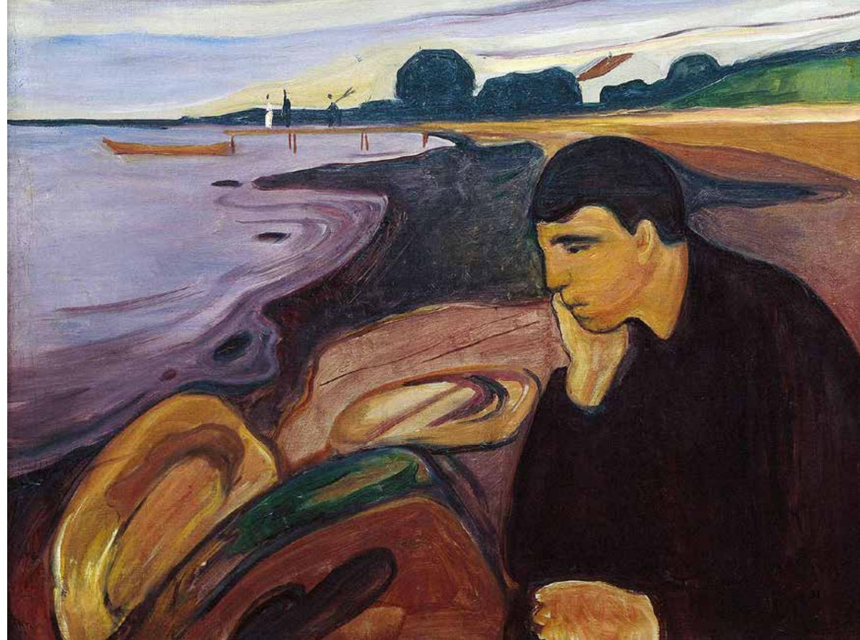
Mélancolie 1894-1896 Norvège, Bergen