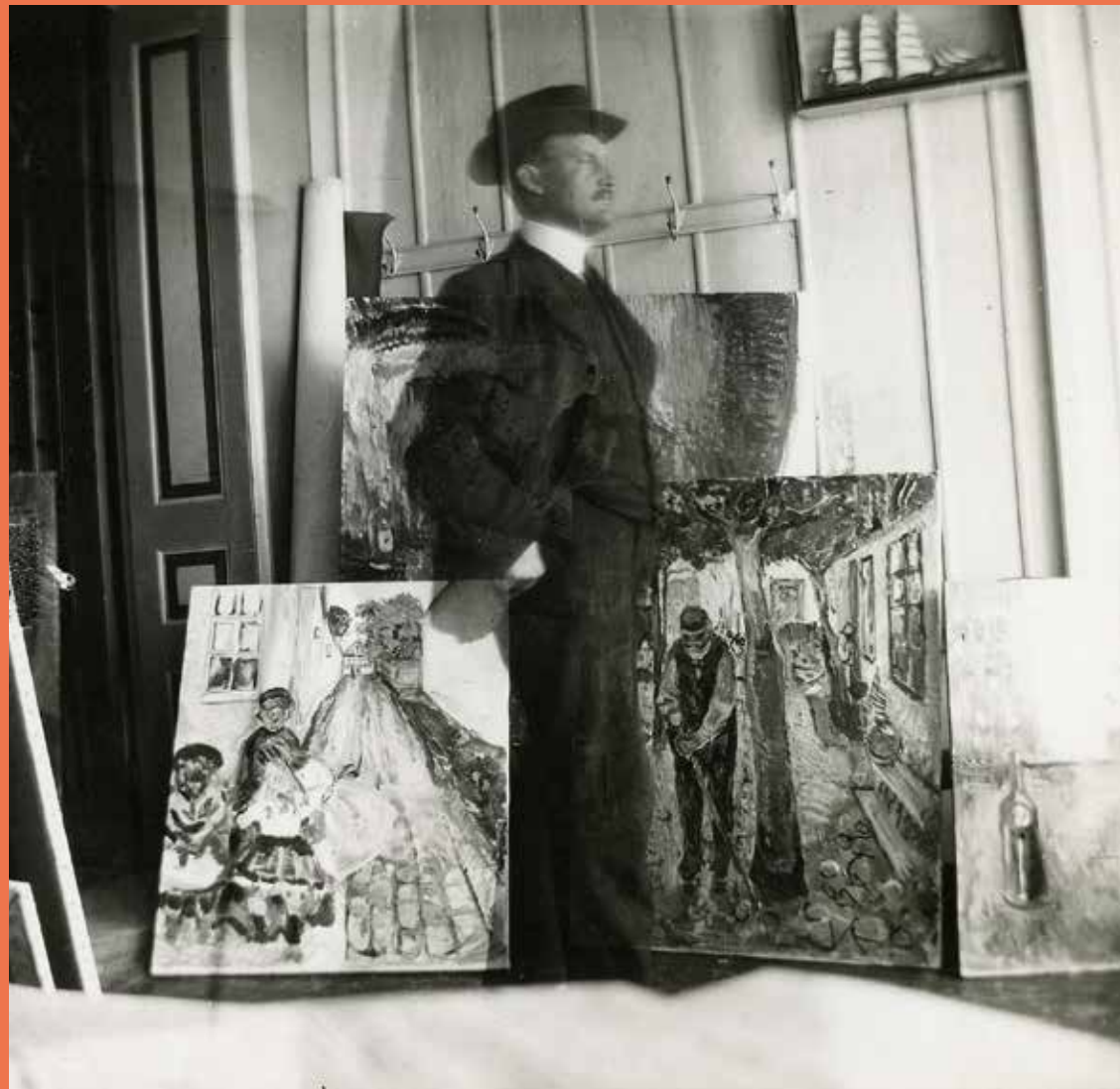
Autoportrait devant ses tableaux, Am Strom 53, Warnemünde Photographie 1907