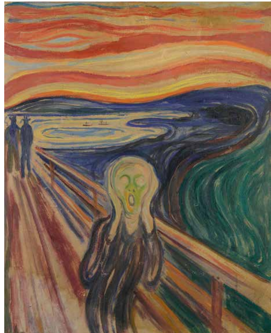
Le Cri 1910 ? Norvège, Oslo, Munchmuseet Munchmuseet