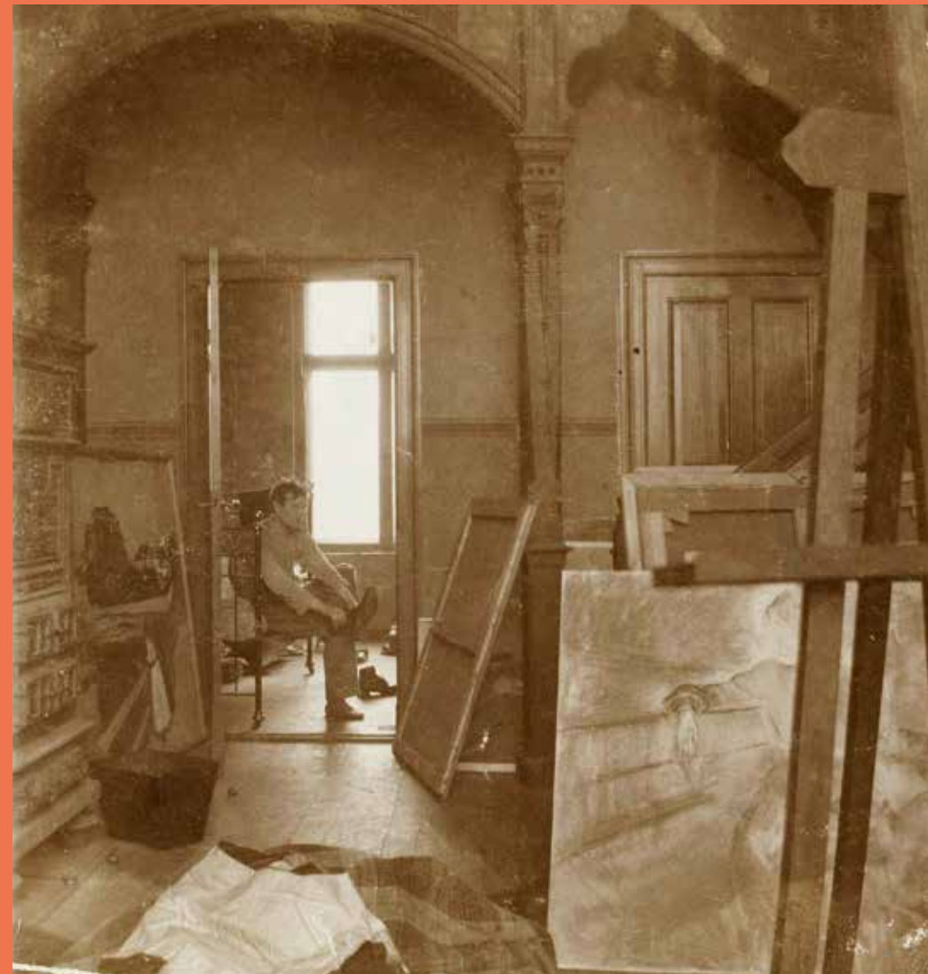
Autoportrait dans le studio, Berlin Photographie 1902