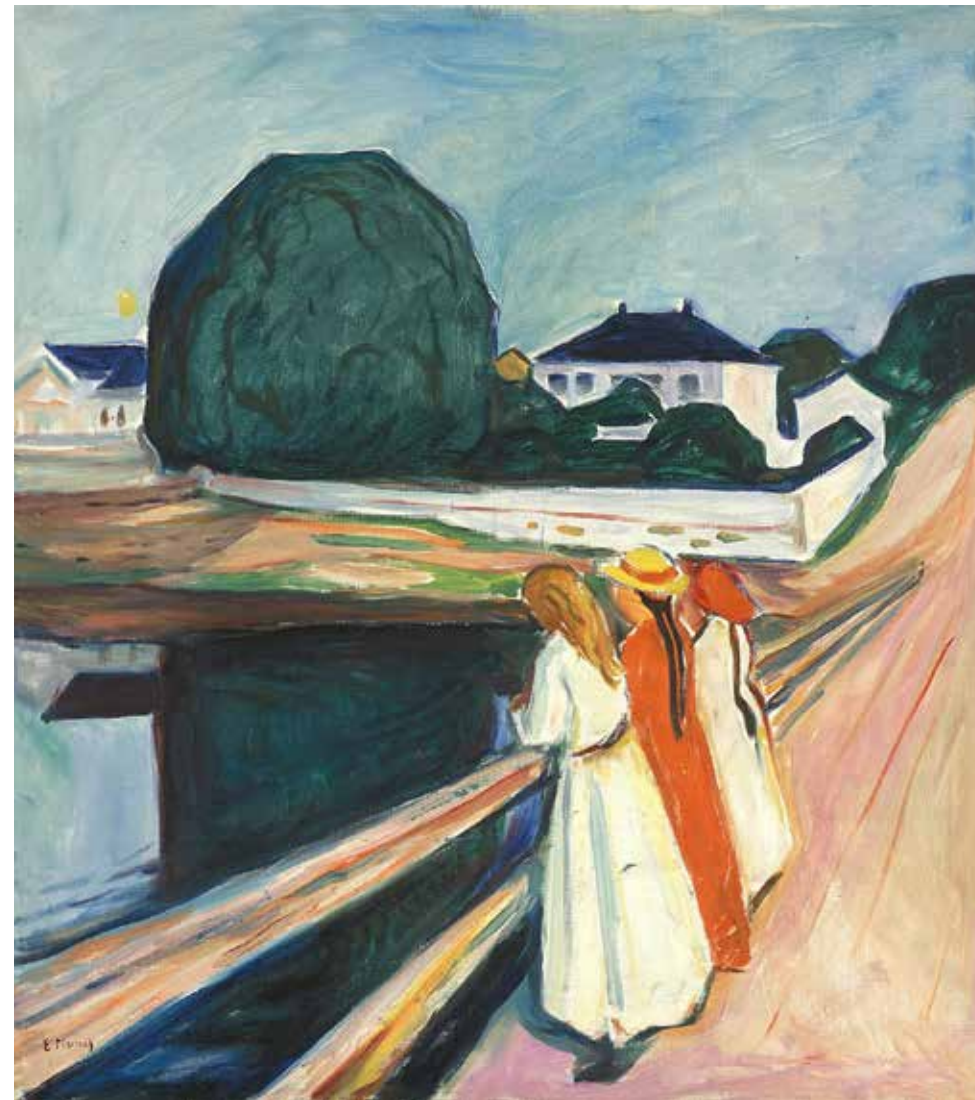
Jeunes filles sur le pont Vers 1927 Norvège, Oslo, Munchmuseet Munchmuseet