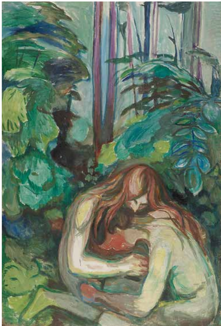
Vampire dans la forêt 1924-1925 Norvège, Oslo, Munchmuseet Munchmuseet