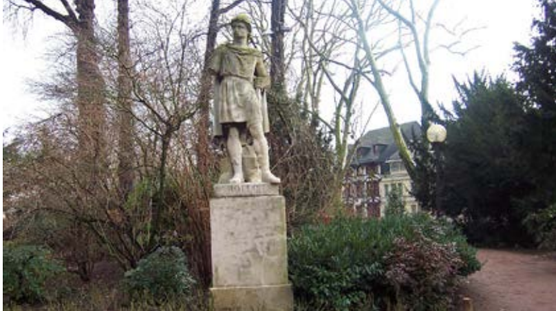
Statue de Rollon dans les jardins de l'Hôtel de Ville de Rouen.

La Normandie a pour origine le mot « Northmen » qui signifie les hommes du Nord, les fameux Vikings, peuples d'origine scandinave, qui envahissent régulièrement à partir de l'an 800 le nord du royaume des Francs. L'un de leurs chefs devient le fondateur de l'actuelle Normandie. Rollon, né vers 850 dans une famille aristocratique d'origine norvégienne ou danoise, débarque dans le royaume des Francs en 876 à la tête d'une bande. Il s'installe à l'embouchure de la Seine, d'où il lance des raids et des pillages dans la région. Vers 890, il quitte la Neustrie, l'ancienne Normandie, pour l'Angleterre, où naît son fils Guillaume, et revient quelques années plus tard. Grâce au pacte de Jumièges signé avec l'archevêque de Rouen, il épargne la ville. Il fait le siège, sans succès, de Paris et de Chartres. Ces défaites pousseront le roi des Francs, Charles le Simple, à négocier une trêve avec Rollon. C'est à Saint-Clair-sur-Epte que le traité est signé en 911 et qui pose les fondations de l'actuelle Normandie.