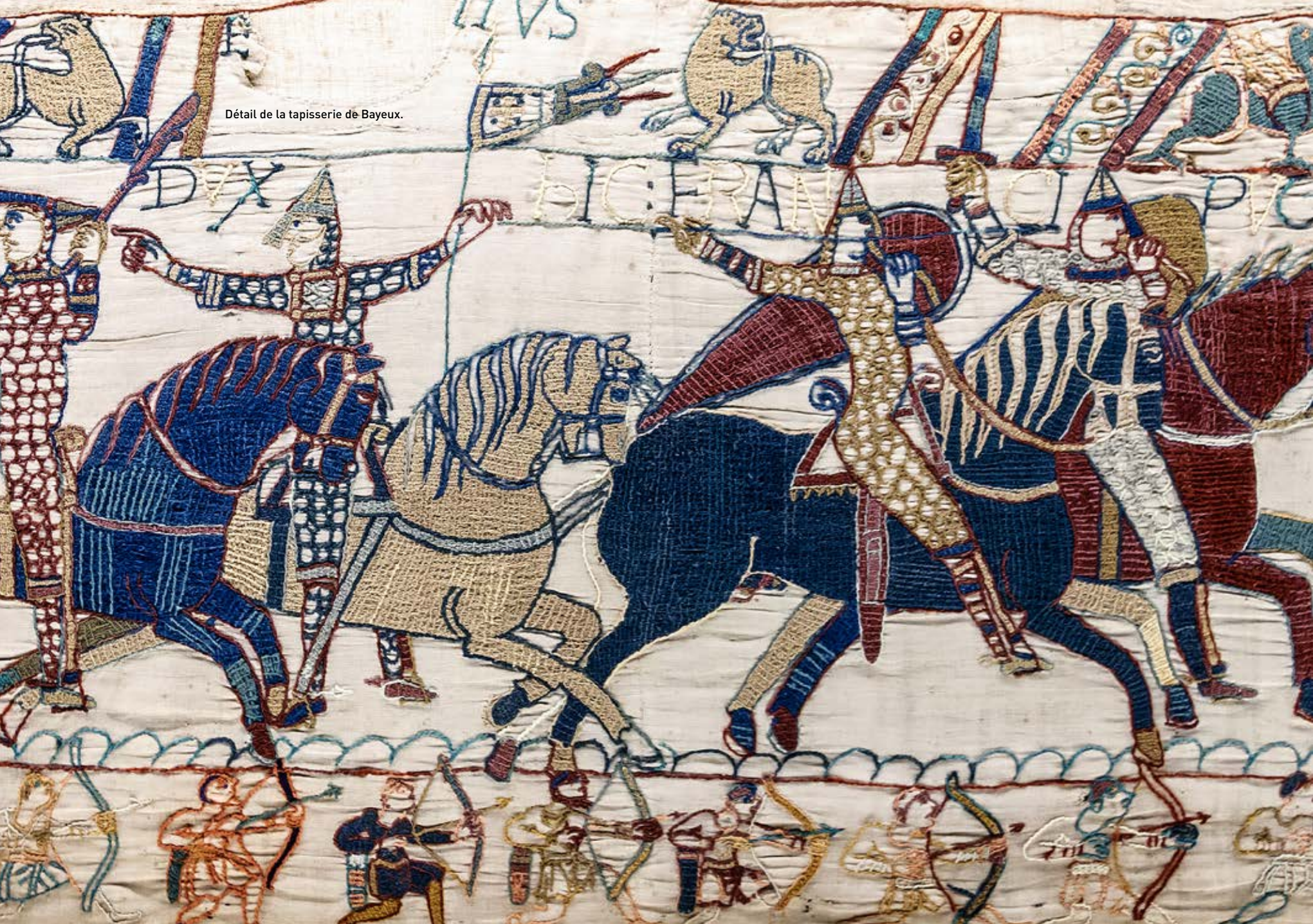
Détail de la tapisserie de Bayeux.