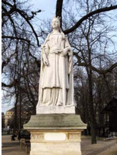
Statue de la reine Mathilde dans le jardin du Luxembourg.