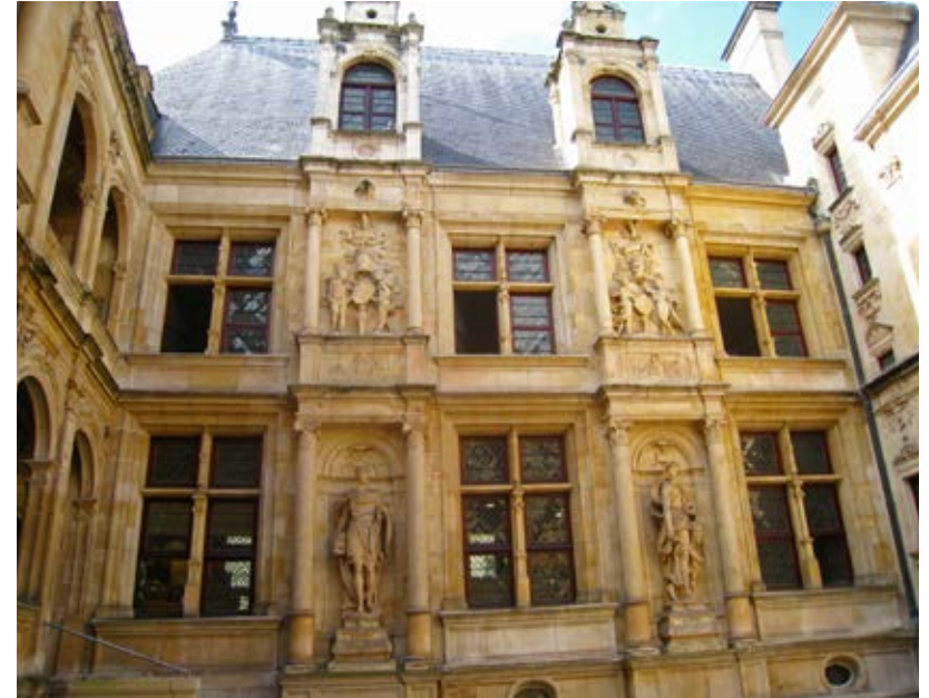
Hôtel d'Escoville à Caen.