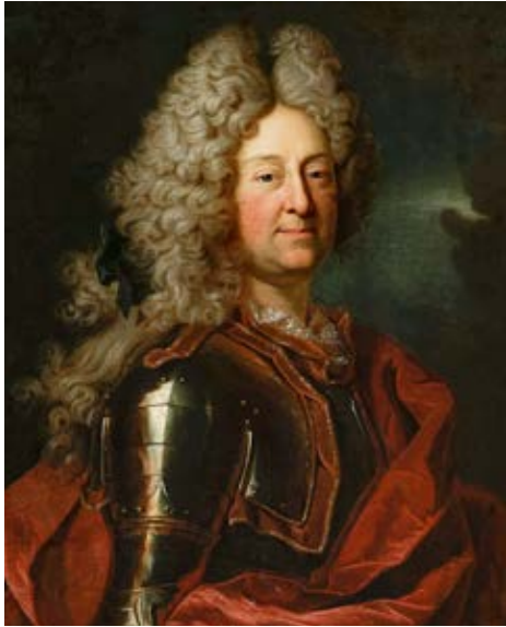
Le maréchal d'Harcourt.

La maison d'Harcourt constitue l'une des plus anciennes familles de la noblesse normande, dont l'origine remonte au XI e siècle. Le chef viking Rollon, devenu en 911 comte de Normandie, distribue à ses fidèles de vastes domaines. La seigneurie d'Harcourt, près de Brionne, échoit à Bernard le Danois, régent du duché de Normandie. Le premier ancêtre de la famille attesté est Robert I er d'Harcourt, dont chacun des fils donnera naissance aux lignées française et anglaise. Son petit-fils Robert II fait construire sous le règne de Jean sans Terre le château d'Harcourt, dont il subsiste encore aujourd'hui des constructions plus récentes. Cette lignée se divise en 1275 en deux branches, la branche aînée dite d'Olonde, celle des marquis d'Harcourt et la branche cadette dite de Beuvron, qui sera érigée en duché sous le règne de Louis