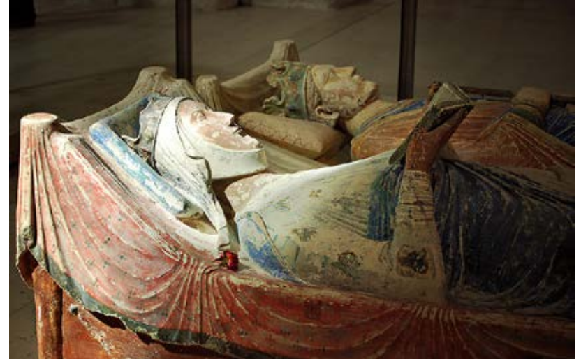
Gisant d'Aliénor d'Aquitaine à l'abbaye de Fontevraud.

enterrée et Guillaume, l'abbaye aux Hommes dédiée à Saint-Etienne. La reine jouera un rôle politique non négligeable, notamment pendant la conquête du royaume d'Angleterre où elle exerce la régence du duché de Normandie. Très éprise de son mari, elle veillera toute sa vie à la bonne harmonie familiale. On lui doit à tort la réalisation de la Tapisserie de Bayeux, dont elle est néanmoins une des figures importantes.