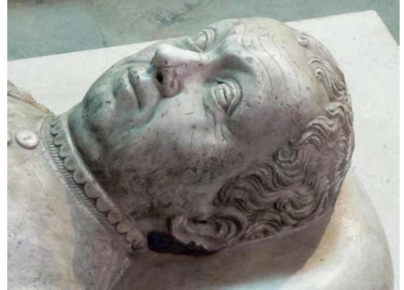
Gisant de Bertrand du Guesclin à la basilique Saint-Denis.

Bertrand du Guesclin est issu d'une famille de la petite noblesse de Bretagne. Né au château de la Motte-Broons près de Dinan, il fait preuve depuis son plus jeune âge d'une force physique et d'un caractère belliqueux. Le jeune chevalier s'illustre rapidement pendant la guerre de Succession du duché de Bretagne et les débuts de la guerre de Cent Ans. Soutenant Charles de Blois, il est craint par les Anglais qui le surnomment « le Dogue noir de Brocéliande ». Il est nommé en 1360 lieutenant de Normandie. Quelques années plus tard, il fait le siège de Mantes, Meulan puis de Valognes et reçoit en remerciement le comté de Longueville dans la vallée de la Scie. A la demande du roi de France, il part