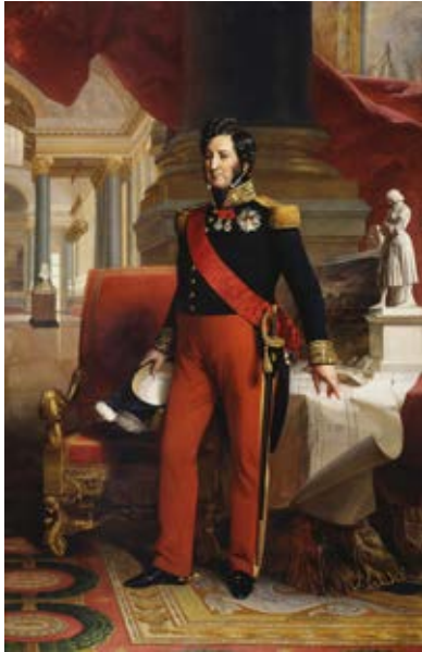
Louis-Philippe Ier, roi des Français (le roi est représenté à l'entrée de la galerie des Batailles qu'il a fait aménager au château de Versailles).

Louis-Philippe est le dernier roi français. Né au Palais-Royal, il est le fils du duc d'Orléans dit Egalité, issu de la branche cadette des rois de France. Il accède à la couronne de France en 1830 à la faveur du renversement de son cousin Charles X. Intrônisé roi des Français, il règne pendant 18 ans sur une France en pleine évolution, tant sur le plan social et économique que politique. Louis-Philippe entretient des relations étroites avec la Normandie. Titré comte d'Eu, il fait de son château normand une des ses résidences royales préférées. Cette terre est entrée par mariage dans la famille d'Orléans en 1661,