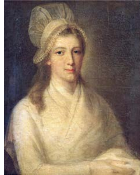
Portrait de Charlotte Corday.

Charlotte Corday réside à Vimoutiers près de Caen dans une modeste famille aristocratique. Son père, ancien lieutenant aux armées du roi, s'installe à Caen à la suite de disputes familiales. Veuf, il confie ses filles à l'abbaye aux Dames jusqu'à la Révolution française. Recevant une éducation complète, la jeune Charlotte se passionne pour la philosophie et les idées révolutionnaires tout en conservant sa foi religieuse. Elle retourne vivre chez son père à la campagne, puis à l'âge de 23 ans, s'installe de nouveau à Caen chez une de ses tantes, où elle participe aux réunions politiques organisées par les Girondins qui ont fui Paris. Au sein de ce cénacle, elle se forge l'intime conviction que Marat, incarnant à ses yeux le mensonge et l'injustice, est l'ennemi de la Patrie. Le 9 juillet 1793, elle quitte Caen pour Paris afin de remplir sa